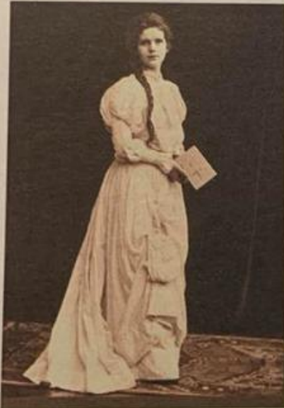
Zdjęcie zrobione przed I wojną światową