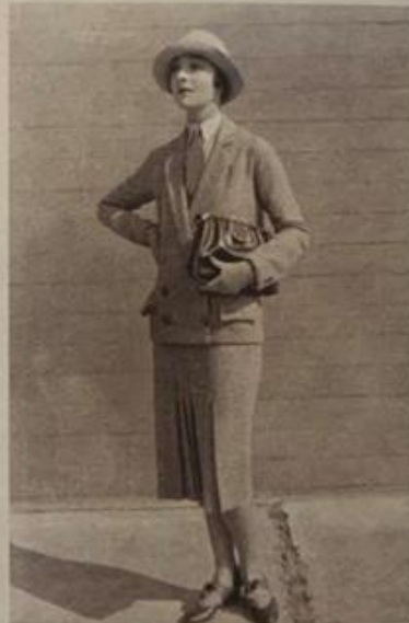
Zdjęcie zrobione po I wojnie światowej