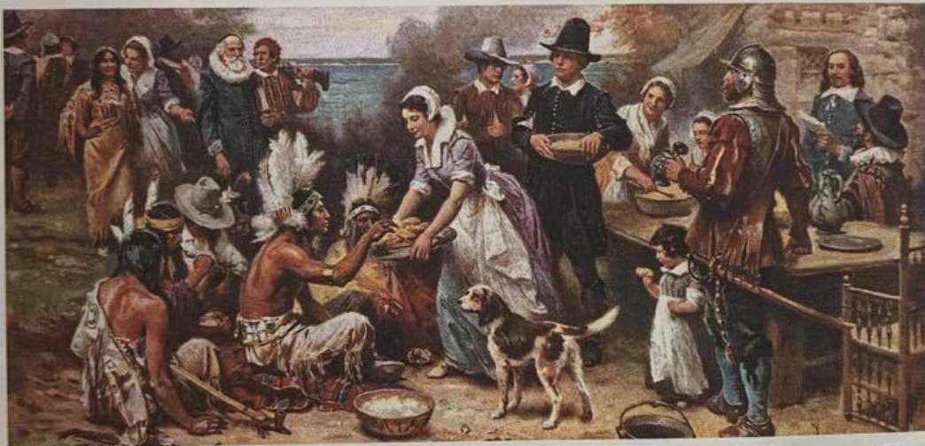
Jean Leon Gerome Ferris, The First Thanksgiving (Święto Dziękczynienia) , 1899.

2. Na podstawie ilustracji oraz wiadomości z podręcznika dokończ poniższe zdania.