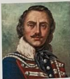
▲ Kazimierz Pułaski.

▲ Jerzy Waszyngton (1) ze swoimi generałami, obraz z XVIII wieku. Kazimierz Pułaski (2) był twórcą i organizatorem amerykańskiej kawalerii. Zginął w brawurowej szarży w bitwie pod Savannah w 1779 roku. Na pamiątkę tego wydarzenia w Stanach Zjednoczonych obchodzi się w październiku Dzień Pamięci Generała Pułaskiego ( General Pulaski Memorial Day ). W 2014 roku Kongres Stanów Zjednoczonych ogłosił Pułaskiego honorowym obywatelem USA za uratowanie w jednej z bitew życia Waszyngtonowi. Obok Pułaskiego stoi Tadeusz Kościuszko (3).