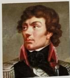
▲ Tadeusz Kościuszko.

► Pomnik Tadeusza Kościuszki w Waszyngtonie. Kościuszko zasłużył się podczas wojny o niepodległość Stanów Zjednoczonych nie tylko jako dowódca, ale także jako inżynier i budowniczy umocnień wojskowych. Był jednym z pierwszych, którzy domagali się zniesienia niewolnictwa czarnoskórych Amerykanów. W swoim testamencie cały majątek, jaki otrzymał za wojenne zasługi od rządu Stanów Zjednoczonych, przekazał na ich wykup z niewoli i zakładanie dla nich szkół.