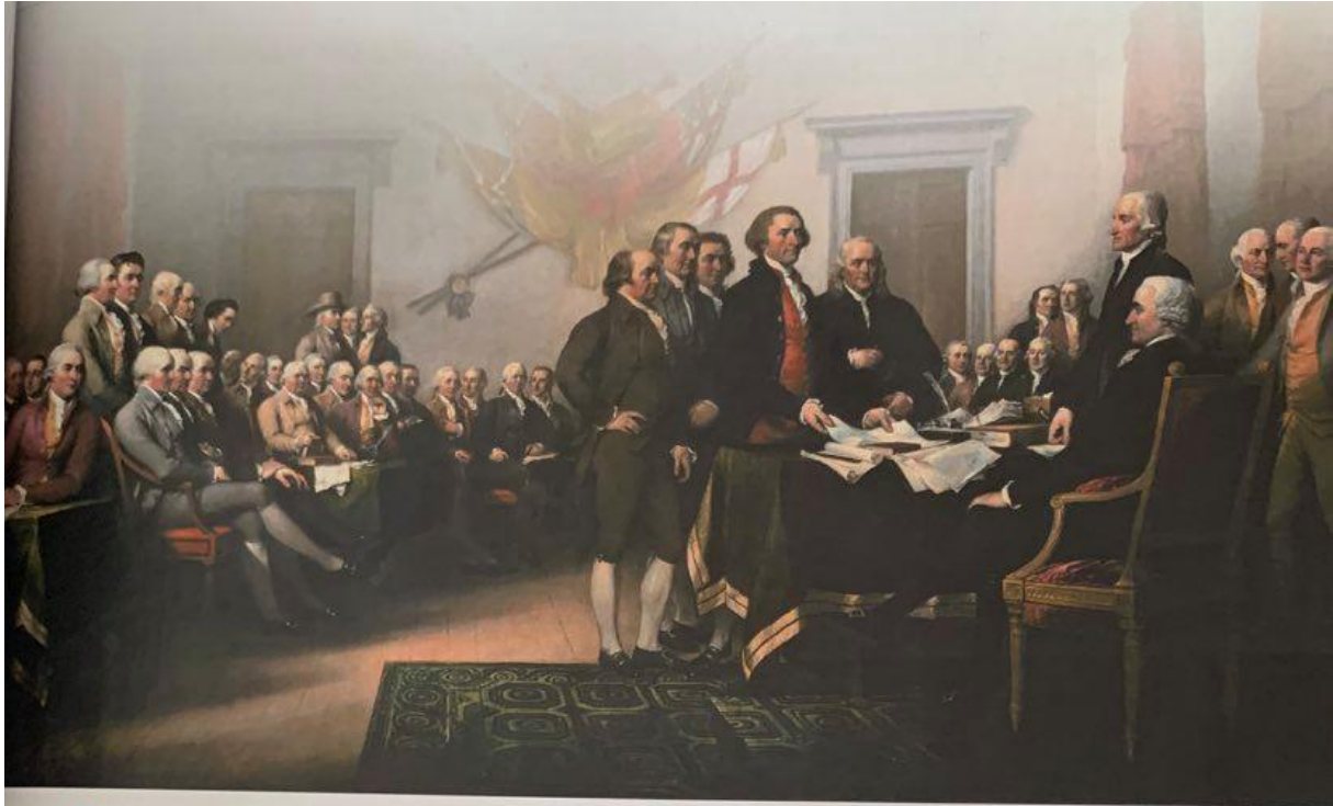
▲ Uchwalenie Deklaracji niepodległości Stanów Zjednoczonych , obraz z początku XIX wieku. Dzień ogłoszenia Deklaracji niepodległości (4 lipca) jest obchodzony do dziś jako święto państwowe w Stanach Zjednoczonych.