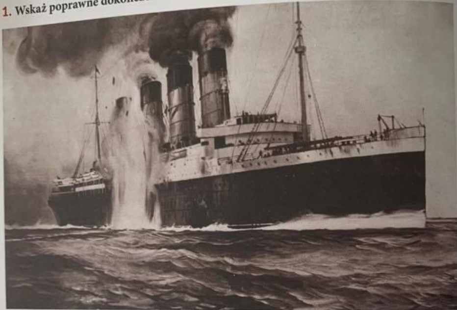
Zatopienie statku pasażerskiego Lusitania 7 maja 1917 r.

Wydarzenie przedstawione na ilustracji stało się przyczyną